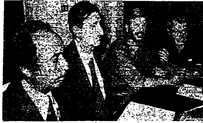
السيد ياسر عرفات والسيد كمال جنبلاط في اجتماع اللجنة المشتركة

ر الكت التنفيذي للجهة العربية رورة في الدورة الفلسطينية اجتماع فده بمس أمس ، دعوة الذاتة للجهة إلى عقد دورة خلال النصف الثاني من ايلول في لندن فورا. الوضع بعد الاطلاق سبناه عن السيد كمال جنبلاط ان رف الرامة تمت قيام حكومة لبنانية مؤقتة للمشاركة في ات والمواقف العربية . ووصف ع القادة السوريين السيد ياسر بها مهمة جدا كان المكتب التنفيذي قد عقد اما بعد ظهر امس ، أصدر في البيان التالي : ر المكتب التنفيذي للجهة العربية رورة في الدورة الفلسطينية اجتمعا ع الاك كمال جنبلاط امس عام و بحضور الأخ ياسر عرفات ر اللجنة التنفيذية لجهة التحرير خطية والاك جلال الكفارنة س العام للجهة والآخر أعضاء ر التنفيذي ياسر عبد ربه ، اسو